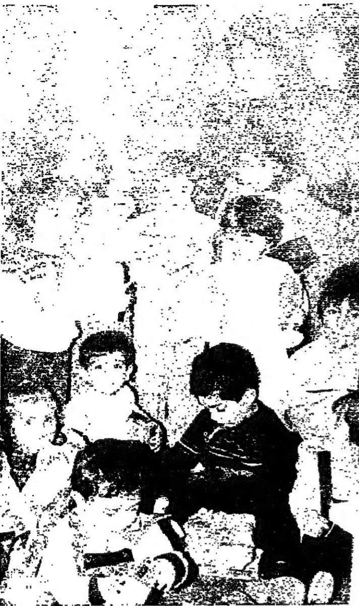
اطفال حضنة سن الليل يحملون الهدايا